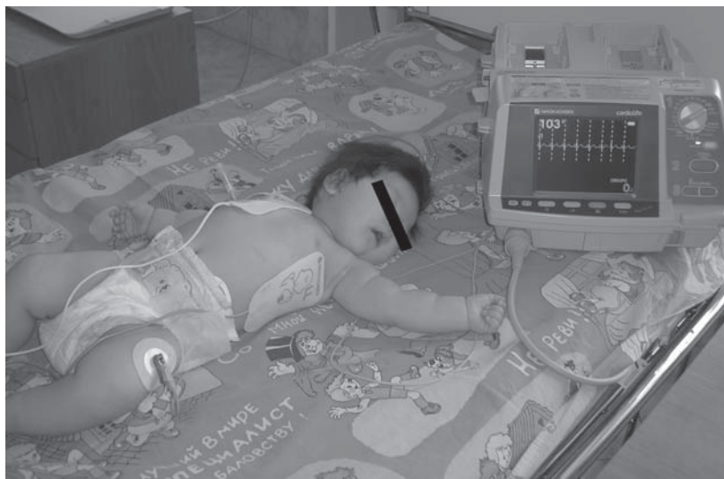
Рис. 3. Проведение кардиоверсии ребенку 3-х месяцев с использованием адгезивных электродов-пластырей.

Условиями успешной кардиоверсии при СВТ у детей раннего возраста являются: