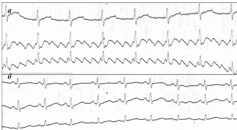
Рис. 2. ЭКГ пациента В., возраст 19 суток, с трепетанием предсердий до (а) и после (б) проведения кардиоверсии.